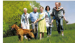
„Sich wohlfühlen im Kreise der Familie“

meszaros PR – Dr. Silke Meszaros – Urachstr. 19 – D-79102 Freiburg Tel: 0761-4587209-0, Fax: -9, Email: info@meszaros-pr.eu