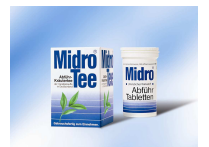
„Pflanzlich, schonend, zuverlässig: Midro Tee und Midro Abführ-Tabletten mit Senna.“